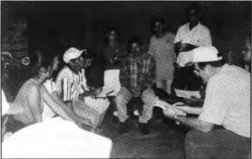
La Misión de Evaluación se entrevista con miembros de CDS, Nueva Concepción.