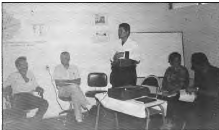
Entrevista con Alcalde y Directiva CDS, Jocoro.

Durante la Misión se pudo observar el inicio de una colaboración entre el PRIAG y el proyecto para vincular la problemática de los CPC con la potenciación de innovadores campesinos.