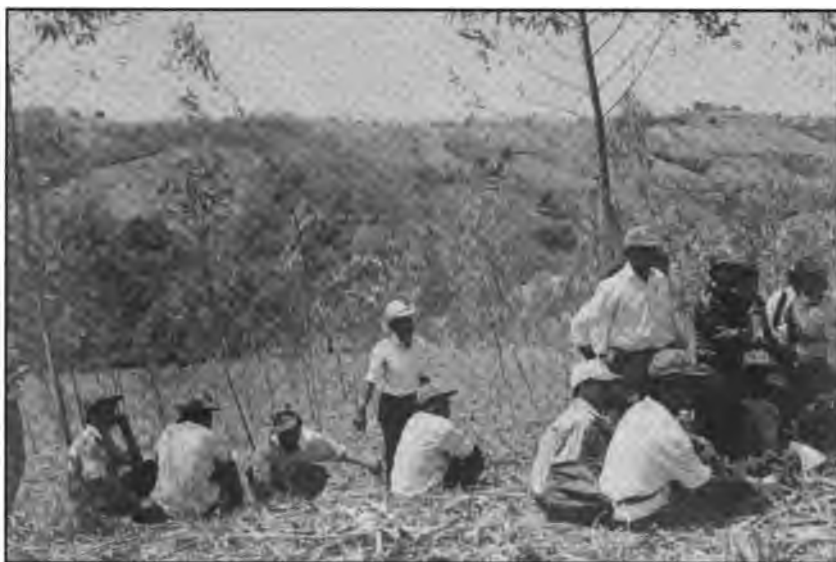
Gira de capacitación de miembros del C.D.S. de Nueva Concepción a Guaymango.

aproximadamente un semestre, en actividades de capacitación, problemática de la violencia doméstica, diagnósticos participativos con enfoque de género.