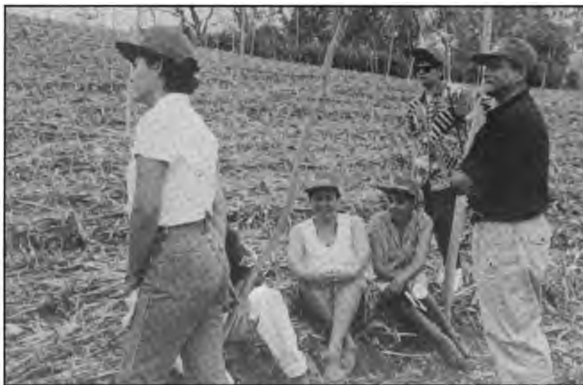
Profesores y Profesoras, realizan una gira de observación por zonas de Guaymango y Jocoro.