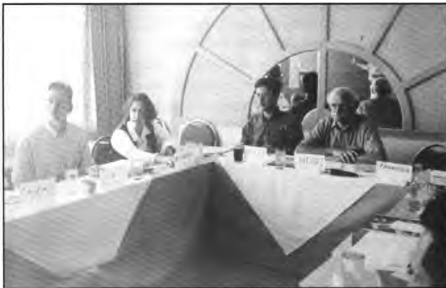
Sesión del Comité Asesor del Proyecto.

Sería conveniente para el proyecto, que tiene un equipo permanente reducido, contar con asistencia técnica (nacional, regional o internacional) que le permita generar procesos de reflexión sobre la multiplicidad de iniciativas que se generan en un proyecto donde se combinan las acciones del propio proyecto, y los desencadenamientos paralelos y posteriores del conjunto de instituciones locales que se vinculan con el proyecto.