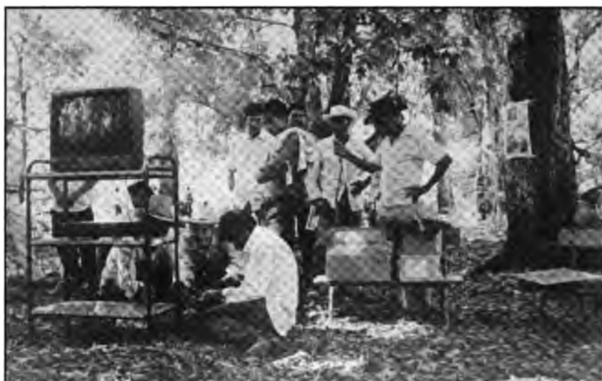
Pequeños agricultores recibiendo capacitación sobre Conservación de Suelos.