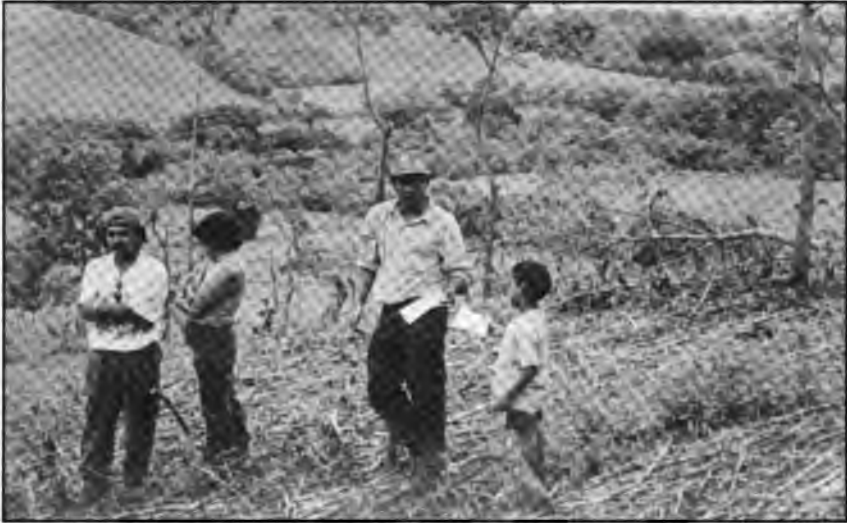
Miembros de C.D.S. Nueva Concepción en parcela, del mismo municipio.

En tercer lugar, en la formulación de la Segunda Fase se deberá balancear entre la ampliación geográfica y la profundización de temas claves como la resolución de conflictos en zonas de laderas (como ya se observa en Yorito, por ejemplo), o el acompañamiento institucional necesario (por parte de los Comites Locales) para concretar en la práctica innovaciones tecnológicas por parte de los sectores campesinos/as.