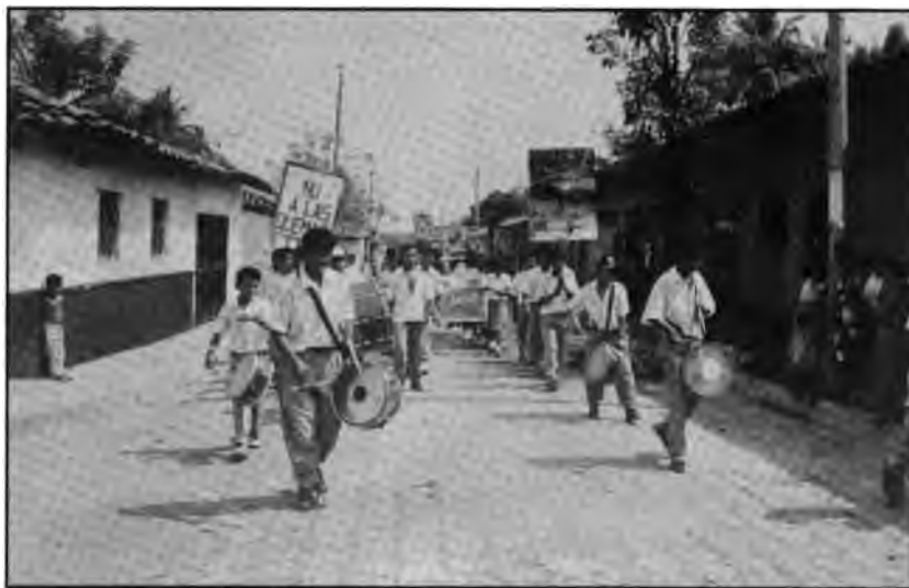
Marcha contra las quemas, realizada en Jocoro, con la participación de todos los sectores.