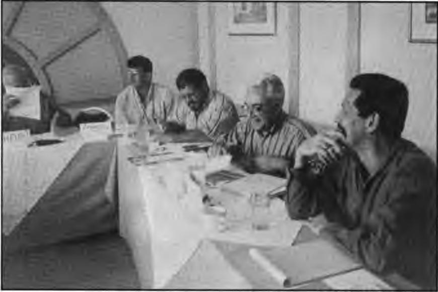
Sesión del Comité Asesor del Proyecto.