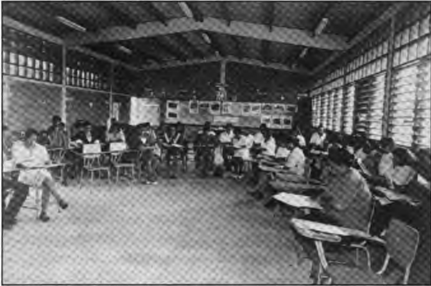
Agricultores y Agricultoras de Sulaco, Honduras, en un Taller de Capacitación.

local con la resolución de problemas estructurales de recursos naturales y extrema pobreza campesina.