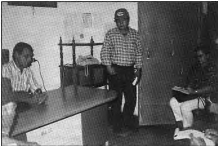
Entrevista con Alcalde y directivos del CDS, Nueva Concepción

5.1. De manera más reciente se han formado algunos comités comunales en San Juan Bautista (Jocoro), Chacalcuyo/Las Brisas (Nueva Concepción) en El Salvador que la Misión pudo visitar. Nuestras impresiones apuntan a: