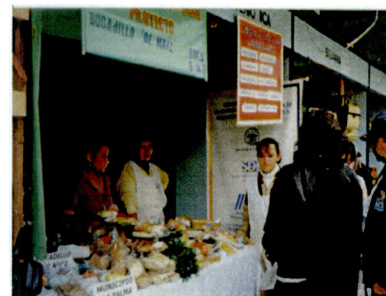
Feria Artesanal y Alimentaria. Arbeláez, Cundinamarca Convenio IICA-Gobernación de Cundinamarca.

Dentro del amplio marco de cooperación que se proporciona a Minagricultura, se ha fortalecido, modernizado y revitalizado la institucionalidad para el manejo de programas de microempresa rural (PADEMER) a través de la contratación y funcionamiento de una Unidad Técnica Nacional la cual fue capacitada por el IICA en Perspectiva de Género para hacer transversal el proyecto. Bajo el esquema mejorado de microcrédito se ampliaron los Fondos de Microcrédito dando apertura y acompañamiento a siete, y se prueba nueva modalidad de microcrédito manejado directamente por dos asociaciones. Se generan avances en la adopción de medidas que permitan mayor flexibilidad y ejecución de los entes financieros. Dentro de este marco, se hizo seguimiento a 40 proyectos, se generaron 45 nuevos, en los cuales se contempló la equidad de género y competitividad, atendándose en todo este proceso a 22 departamentos y en ellos a 12.686 usuarios.