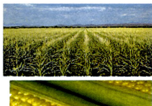
Proyecto Malces, Residencia

A través del Programa Cooperativo de Innovación Tecnológica Agropecuaria para la Región Andina-PROCIANDINO , se trabaja en la vinculación de Colombia a la operación del Observatorio Andino de Innovación Tecnológica, para lo cual se cuenta con un directorio de más