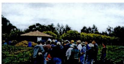
Preparación de Compost. Capacitación del IICA en Agricultura Biodinámica

D. TECNOLOGÍA E INNOVACIÓN.- A través del PPZRC se desarrollan acciones prototipo para proteger las reservas de bosques tropicales húmedos y los territorios de pueblos indígenas adyacentes a las ZRC. Ello involucra, acciones de preservación de microcuencas como mecanismo de sensibilización comunitaria, formulación del Plan de Ordenamiento Ambiental Productivo (POAP) general y predial, establecimiento de sistemas de producción sostenible (metodología de "labranza mínima"), estudio de impacto de las ZRC en comunidades indígenas aledañas.