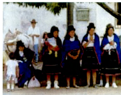
Comunidad Guambiana, Departamento del Cauca

En apoyo al Instituto Colombiano para la Reforma Agraria – INCORA, se efectuaron 38 estudios socioeconómicos, jurídicos y de tenencia de resguardos indígenas en los Departamentos del Cauca, Nariño, Putumayo y Tolima. Con dichos estudios, necesarios para el acceso a las comunidades indígenas a tierras, se garantiza bajo condiciones de legalidad, la conservación de su cultura étnica e identidad, así como mayor solidez a su gobierno o justicia propia. En forma similar, se tuvieron importantes avances en la clarificación de 20 predios poseídos en San Bernardo del Viento en el Departamento de Córdoba, y se efectuaron 138 providencias de recuperación de predios en Islas del Rosario en el Departamento de Bolívar.