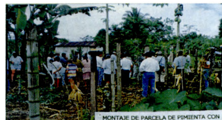
Acciones PRONATTA con comunidades (Convenio IICA-Minagricultura)

Por otra parte, en apoyo a Minagricultura, se ha venido dando seguimiento a la construcción de una nueva cultura del desarrollo tecnológico agropecuario , con énfasis en la producción de pequeña escala, a través del Modelo PRONATTA para asignación y aplicación de fondos públicos en forma transparente, descentralizada, participativa, con rigor técnico, y promoviendo sinergias entre actores locales y regionales interesados en el desarrollo tecnológico al servicio de comunidades de productores de escala pequeña. Así mismo, se ha estimulado la construcción de patrimonio social de esas comunidades y actores en forma de tejido social, institucionalidad y capacidad de gestión del desarrollo tecnológico.