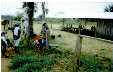
Con apoyo del PPZRC, construcción de cercas vivas por parte de las comunidades (Convenio IICA-Minagricultura)

proyectos de fomento a microempresas, y emprendimientos productivos con población marginada de empleo y desarrollo regional, proceso en el cual se benefician 19 municipios de la "línea eléctrica"; de ello se ha generado metodología plasmada en una publicación.