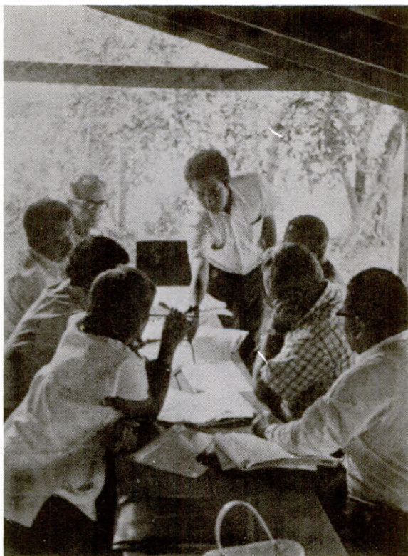
Asesoría al Programa de Reforma Agraria de El Salvador (Grupo de Trabajo)