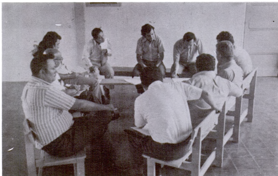
Asesoría al Programa de Reforma Agraria de El Salvador (Grupo de Trabajo)

Durante los primeros meses de 1973 se asesoró al Programa de Reforma Agraria en la reorganización del Instituto de Colonización Rural (ICR). Como parte de la asesoría se ofreció un Curso de una semana a 32 técnicos del ICR, sobre: a) Organización y política del ICR, b) Métodos y técnicas de supervisión y c) Procedimientos de planificación y asesoría (supervisión) al personal de campo. Asistieron al mismo, Directores de Departamento, Supervisores e Instructores. Además, se elaboró un plan de acción para los funcionarios del ICR en cada una de las colonias; se dio una idea sobre el contenido de la presentación y definición de política que hiciera el Presidente del ICR; se dio una charla sobre el proceso de planificación (diagnóstico, problemas, prioridades, medios, ordenamiento de predios) y se asesoró a los grupos de las empresas.