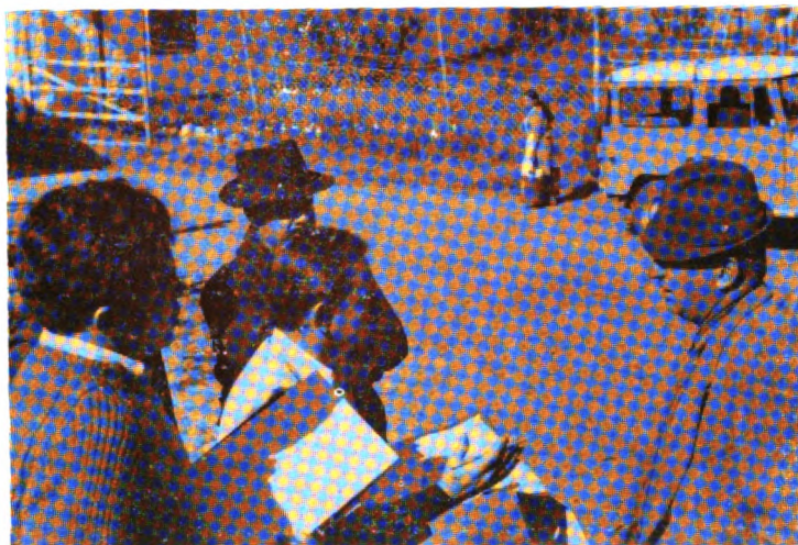
Cooperación en acciones de planificación agrícola.

Como parte integrante de esta línea de acción del Instituto Interamericano de Ciencias Agrícolas, se tuvieron los proyectos de fortalecimiento de organismos nacionales dedicados a la planificación agrícola, así como a la administración y gestión de las organizaciones del desarrollo del sector agrícola ecuatoriano.