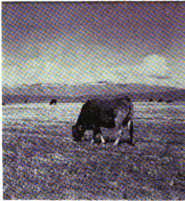
Investigación en ganadería

A nivel nacional, se establecieron los rubros de trabajo en investigación para utilizar en conjunto recursos para resolver problemas comunes, a nivel de la Zona Andina. Estos rubros de investigación común son: oleaginosas, ganadería, leguminosas y cereales. Cabe señalar que existe un amplio consenso entre los directivos de la investigación agrícola, en la necesidad de integrar sus esfuerzos y tratar de orientarlos hacia el aumento de la producción en dichas áreas.