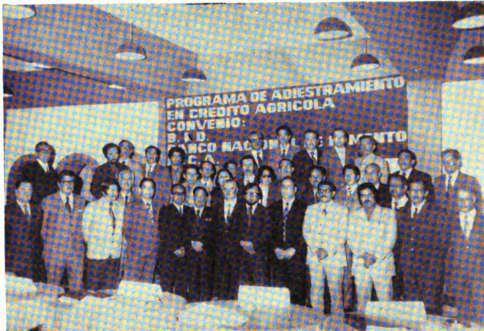
Participantes a un curso de capacitación en crédito agrícola.

Con respecto a la asistencia a las instituciones nacionales de conservación y manejo de tierras y aguas, se pudo realizar un diagnóstico de la situación de estos recursos, para definir las posibles actividades de apoyo a planes y programas nacionales. También se capacitó a técnicos nacionales en aspectos de administración de distritos de riego. Estas capacitaciones se realizaron en el país y en el extranjero.