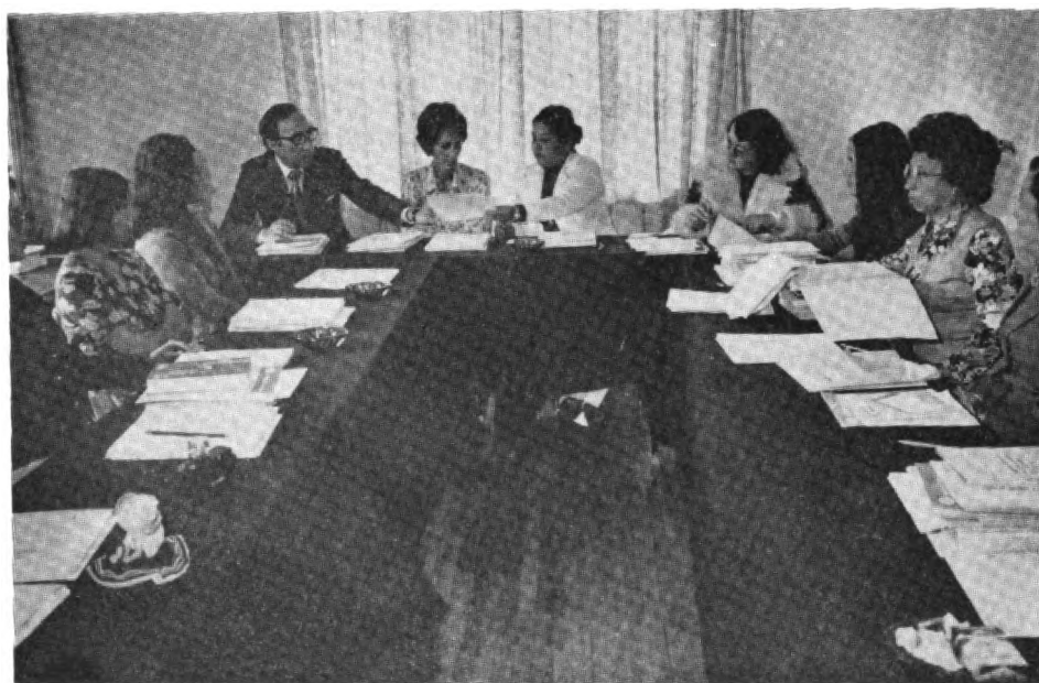
Cuarta reunión nacional de bibliotecarios y documentalistas agrícolas de Ecuador (AIBDA | Ecuador).

La colaboración a las bibliotecas agrícolas nacionales, del MAG y de algunas universidades, así como con la filial de la AIBDA en Ecuador, tuvo por finalidad fundamental apoyar la compilación de información agrícola para su integración al Sistema Interamericano de Información Agrícola (AGRINTER) y la capacitación del personal de especialistas nacionales.