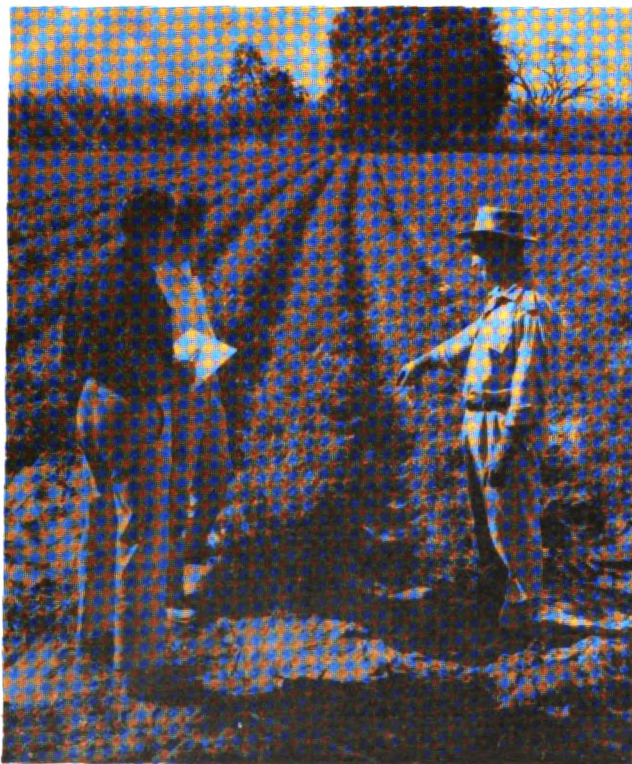
Capacitación en pro de la reforma agraria y desarrollo rural.

Por otro lado, se realizó una capacitación sobre administración de proyecto de reforma agraria y desarrollo rural, para funcionarios del MAG, IERAC, Conscripción Agraria Militar y otros, interesados en el particular.