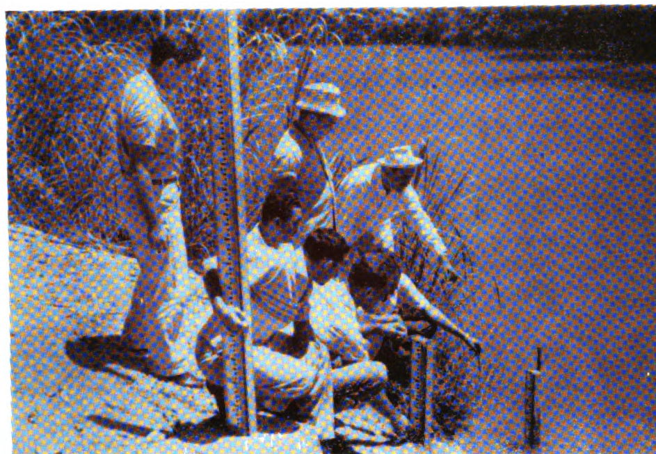
Capacitación en administración de distritos de riego.

Las actividades realizadas por el IICA, para el fortalecimiento de las instituciones ecuatorianas, fueron: