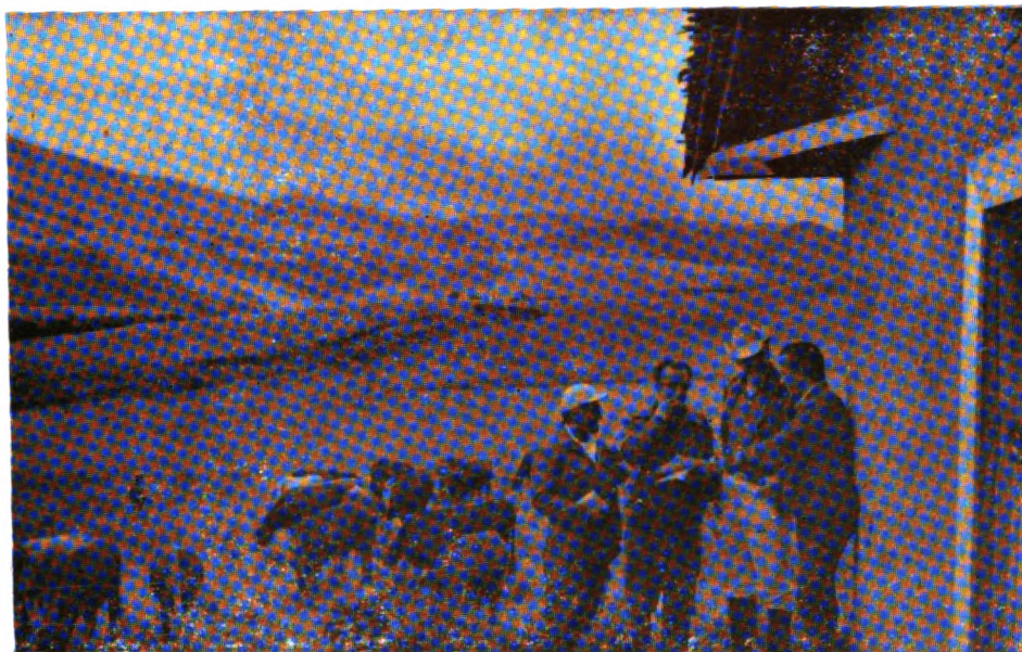
Acciones para la transferencia de tecnología agropecuaria.

La problemática de la transferencia de tecnología a los productores en el sector agrícola, se analizó a nivel de países de la Zona Andina, con la participación de especialistas ecuatorianos. Estas reuniones regionales tuvieron por objetivo, propiciar el uso de metodologías apropiadas por parte de las instituciones responsables de ello.