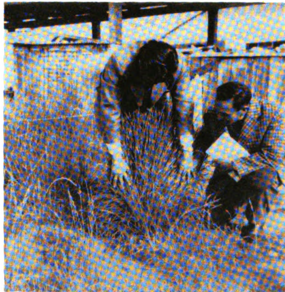
Evaluación fenológica de pastos