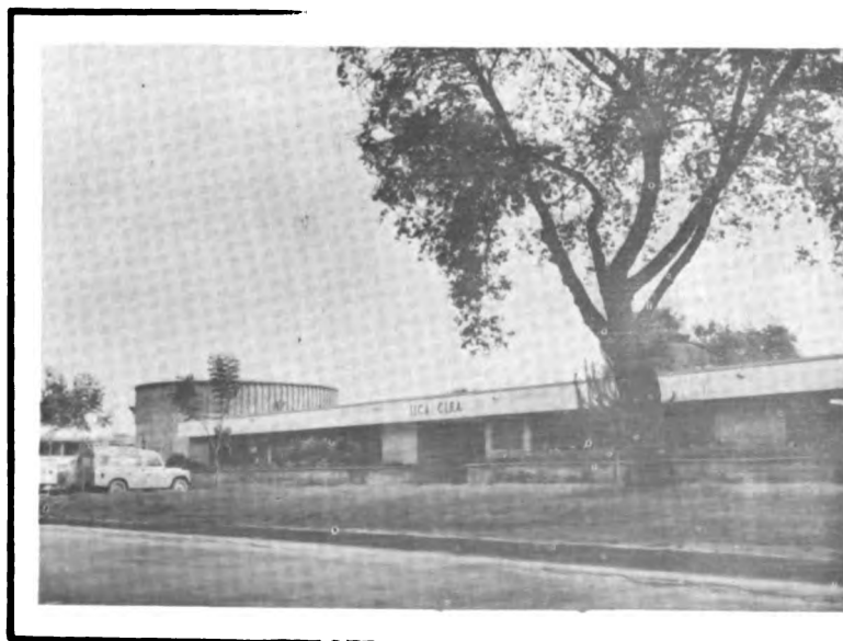
Foto 2. • Sede del IICA-CIRA en la Ciudad Universitaria de Bogotá.