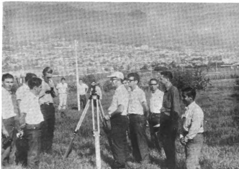
Foto 1.- Aula práctica de cambio sobre localización de canales.

Como parte del curso, los profesores y alumnos visitaron el distrito de riego Roldanillo, La Unión-Toro, Proyecto Valle N° 1.