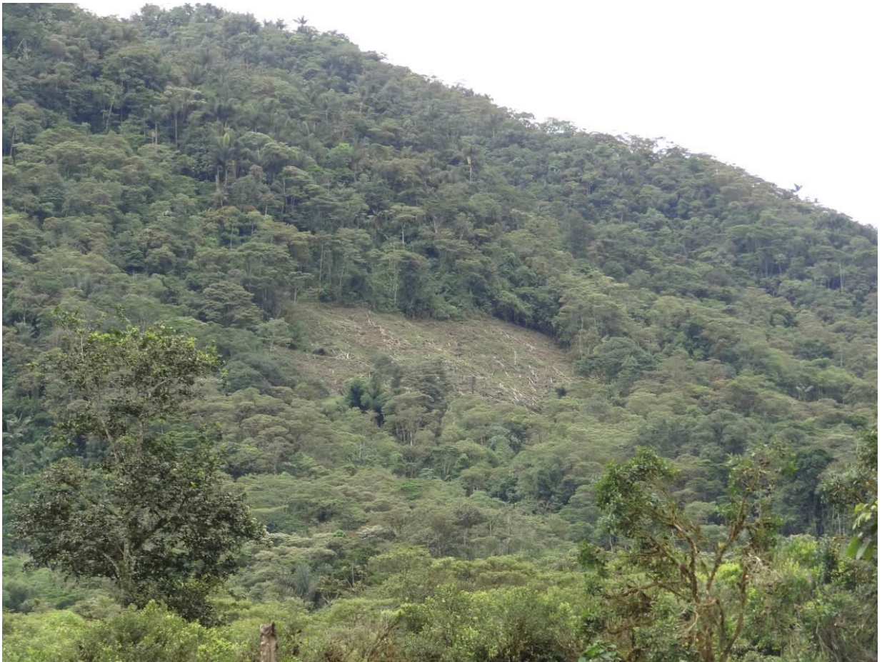
Foto 1. Deforestación por avance de la frontera agrícola (cultivo de naranjilla). Parroquia Río Negro, cantón Baños de Agua Santa, provincia de Tungurahua. 2016

El principal impacto en la zona ha recibido el uso del suelo, por la pérdida de la cobertura vegetal, ocasionada por la deforestación para la implementación del cultivo migratorio de naranjilla y que ha generado también la erosión del suelo, por el uso de agroquímicos de sello rojo en este cultivo.