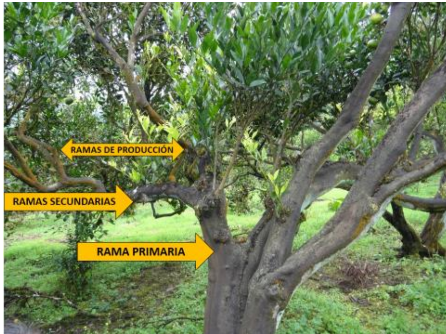
Foto 3. Tipos de ramas. Comunidad San Francisco, parroquia Río Negro; cantón Baños de Agua Santa, provincia de Tungurahua. 2016.

crecimiento de la planta porque la debilitan al absorber los nutrientes en su rápido crecimiento.