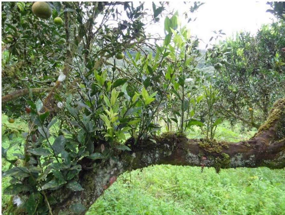
Foto 5: rama secundaria compiten en su crecimiento con chupones. Comunidad San Francisco, parroquia Río Negro; cantón Baños de Agua Santa, provincia de Tungurahua. 2016.