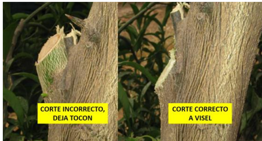
Foto 6. Tipos de corte en la poda de mantenimiento 6 .

de la rama o tronco, y de forma que ocasione la herida más pequeña posible, para que se acelere su cicatrización.