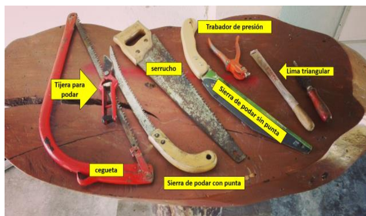
Foto 7. Herramientas para realizar la poda de mantenimiento. Comunidad San Francisco, parroquia Río Negro; cantón Baños de Agua Santa, provincia de Tungurahua. 2016.

Todo corte se realizará lo más limpiamente posible, con herramientas perfectamente afiladas, ya que al hacer un corte se rompe tejido vegetal. Las herramientas que se utilizan para realizar la poda son: