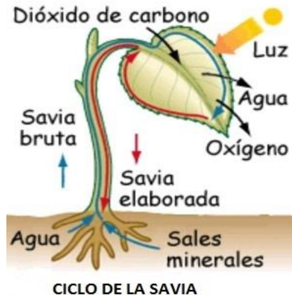
Gráfico 1. Ciclo de la savia en las plantas 5

formada por Hidratos de Carbono (azúcares), Proteínas, y las hojas lo distribuyen a: hojas, brotes, ramas, frutos.