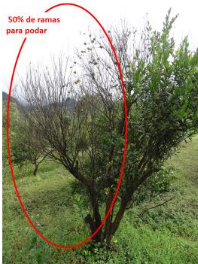
Foto 4. Planta de mandarina que muestra el desequilibrio entre la copa y el sistema radicular, se puede observar claramente que más del 50% de la copa requiere de una poda. Comunidad San Francisco, parroquia Río Negro; cantón Baños de Agua Santa, provincia de Tungurahua. 2016.