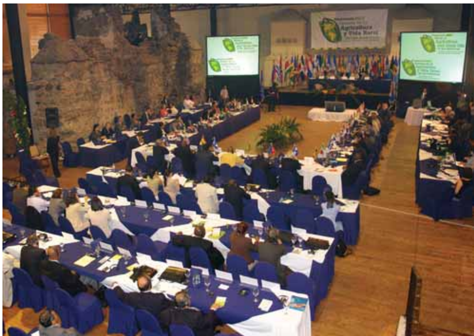
La más reciente reunión ordinaria de la JIA, celebrada en La Antigua, Guatemala.

a) Solicitar al Director General del IICA promover y facilitar la cooperación horizontal entre los Estados Miembros y la sistematización y difusión de experiencias exitosas en materia de seguros agropecuarios y fondos de garantía.