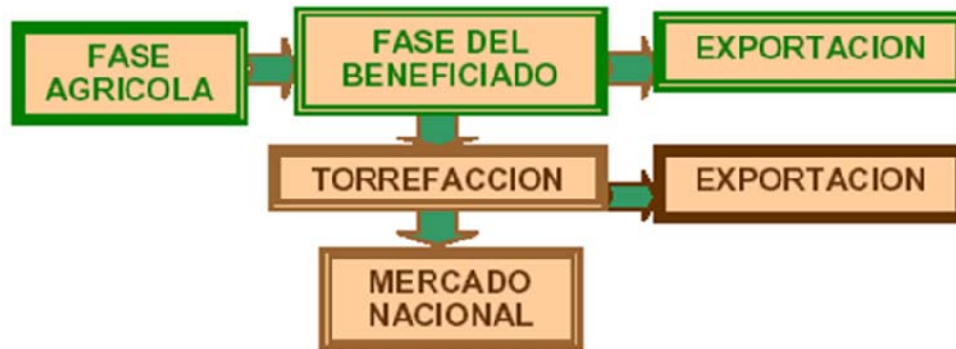
FIGURA 1 : CADENA NACIONAL DEL CAFE