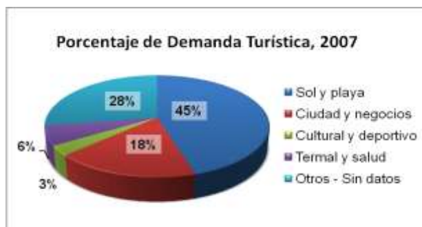
Gráfico N° 2: Porcentaje de visitantes ingresados a Uruguay, según producto turístico demandado en el año 2007.