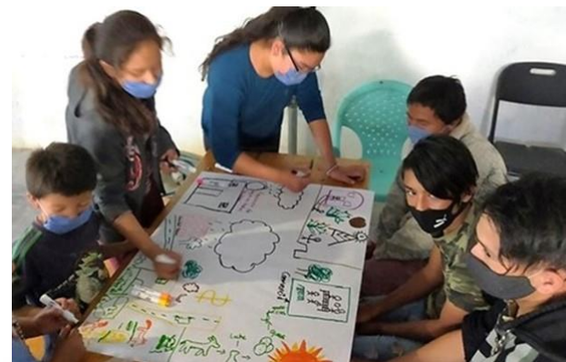
Reactivación de la Asamblea General para el fortalecimiento de la gobernanza local