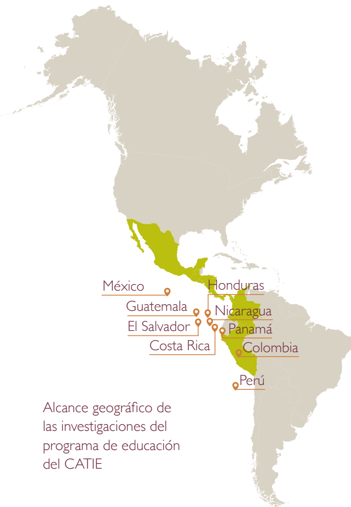
Alcance geográfico de las investigaciones del programa de educación del CATIE

Para incentivar este proceso, la Escuela de Posgrado realizó en el mes de octubre de 2017 su I Simposio de Investigación en el que se presentaron 28 anteproyectos de las maestrías académicas, los cuales impactarán a nueve distintos países. El desarrollo del simposio se dividió en cuatro áreas vinculadas con el quehacer del CATIE: economía, desarrollo y cambio climático; agroforestería y agricultura sostenible; manejo y conservación de bosques tropicales y biodiversidad; y gestión integral de cuencas hidrográficas.