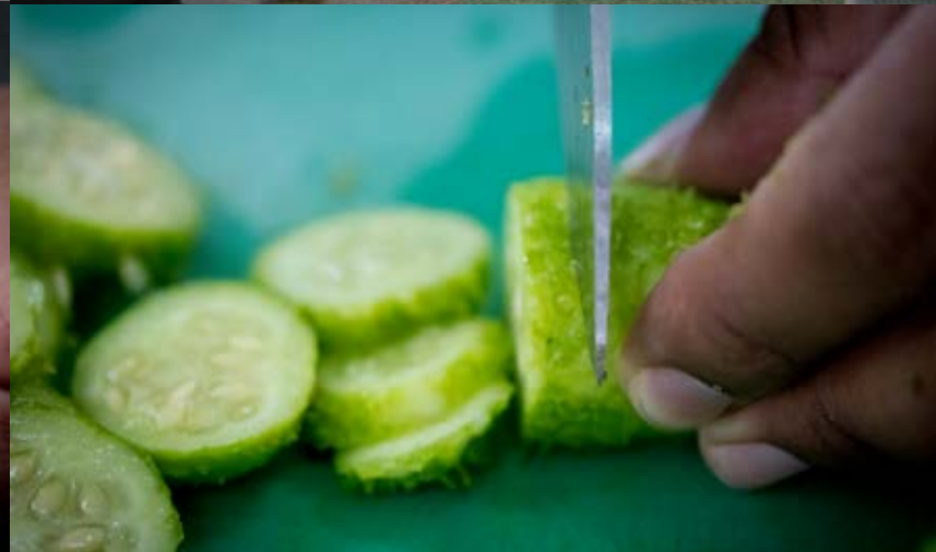
aulas práticas SENAC Aracaju | ingredientes, corte, montagem e apresentação