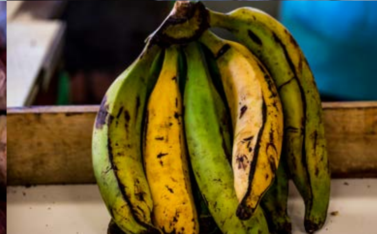
aulas práticas | visita ao Mercado Municipal Antônio Franco | Aracaju - SE