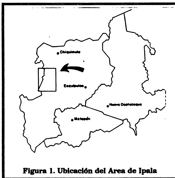
Figura 1. Ubicación del Área de Ipala

El estudio semidetallado de suelos del área de Ipala, comprende una superficie total de 3.463,96 Ha.