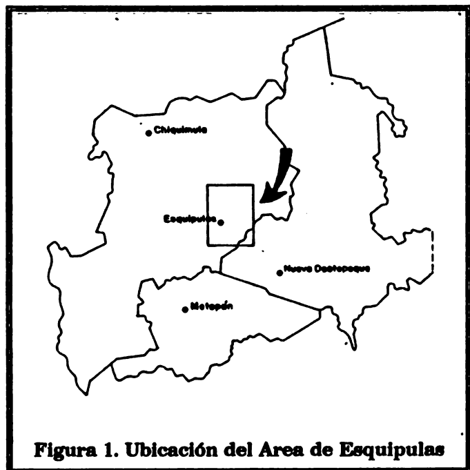
Figura 1. Ubicación del Area de Esquipulas

Su ubicación geográfica está comprendida dentro de las coordenadas 14^{\circ}33'00'' y 14^{\circ}41'00'' Latitud Norte, 89^{\circ}16'30'' y 89^{\circ}22'00'' de Longitud Oeste. Su elevación va de 760 a 1.020 msnm. (Ver Figura 1).