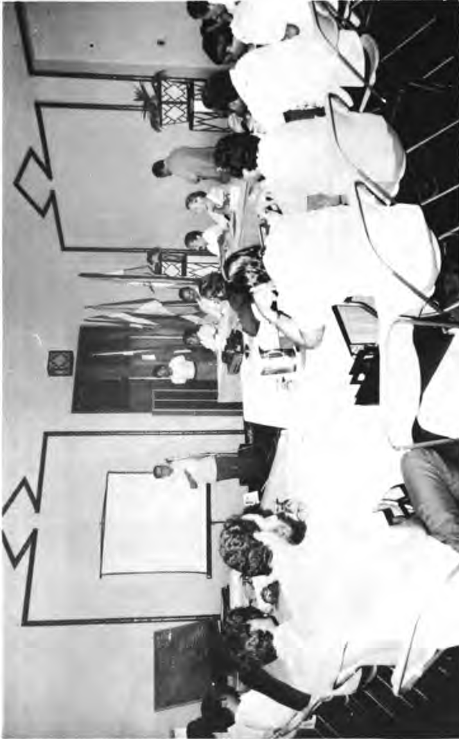
XIII Reunión de Ejecutivos de Reforma Agraria del Istmo Centroamericano y República Dominicana, Reunión Ordinaria de la Junta Directiva del PRACA. Uno de los Ejecutivos del PRACA exponiendo las políticas y realizaciones en Reforma Agraria en la década de los años setenta en su país.