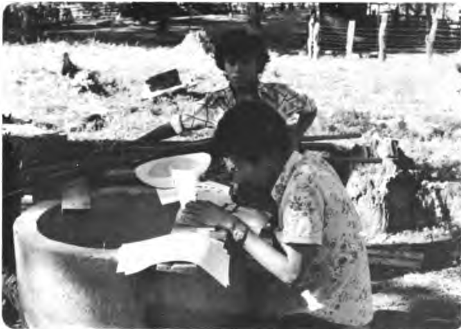
Laboratorios Experimentales. Uno de los campesinos participante, en el laboratorio experimental, elaborando el plan de trabajo de la comisión de educación.