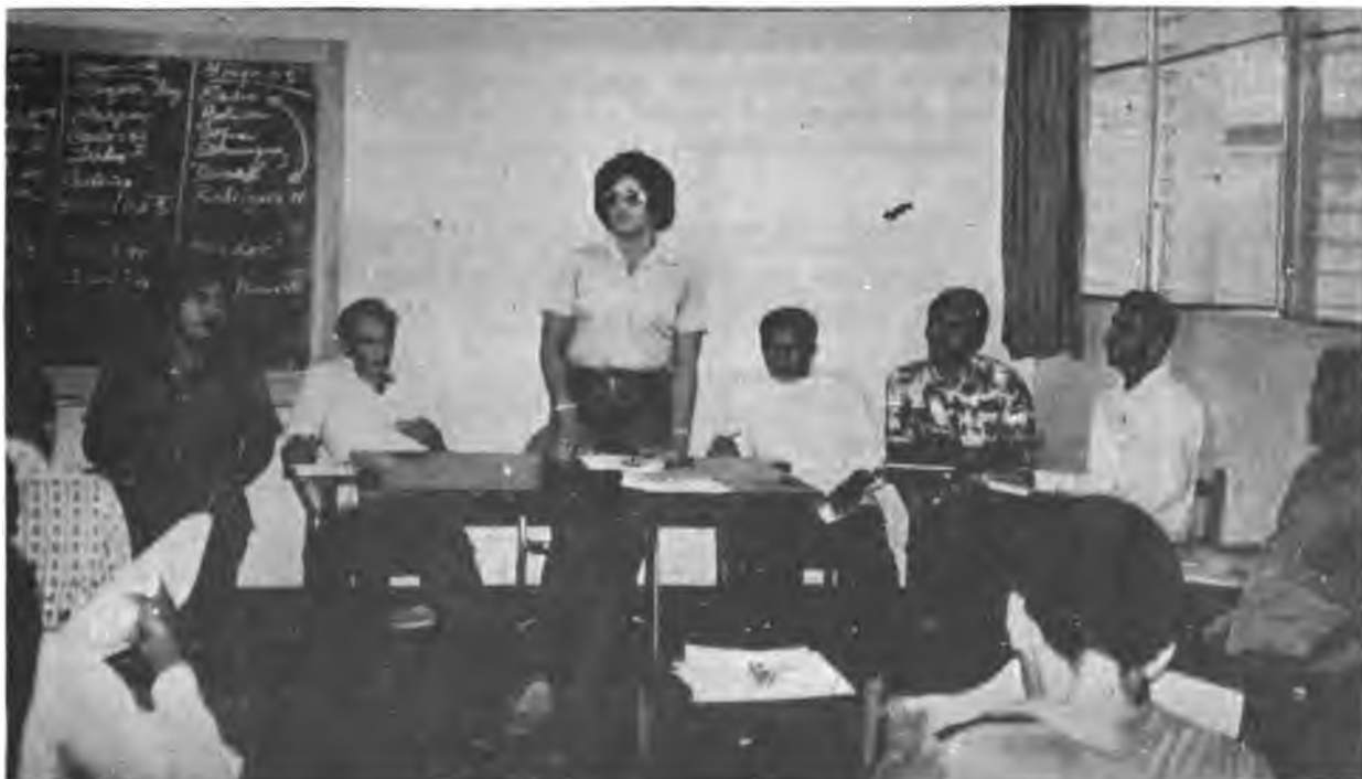
Presentación de trabajo de grupos.

El apoyo logístico y el manejo de los recursos técnicos y económicos fue responsabilidad de una comisión nombrada por la Dirección Nacional de Desarrollo Social. Es importante destacar el significativo aporte realizado por las Direcciones Regionales que asumieron durante el tiempo de la capacitación, las tareas de campo que realizan regularmente los coordinadores sociales.