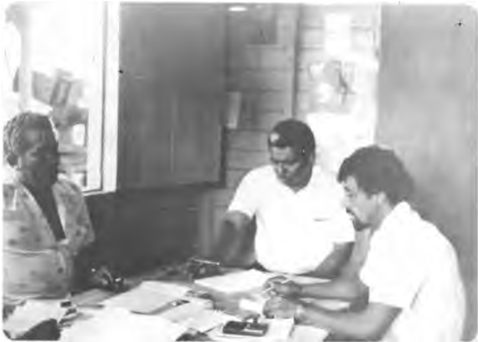
Laboratorios Experimentales. Campesinos practican la administración de la empresa durante el laboratorio.