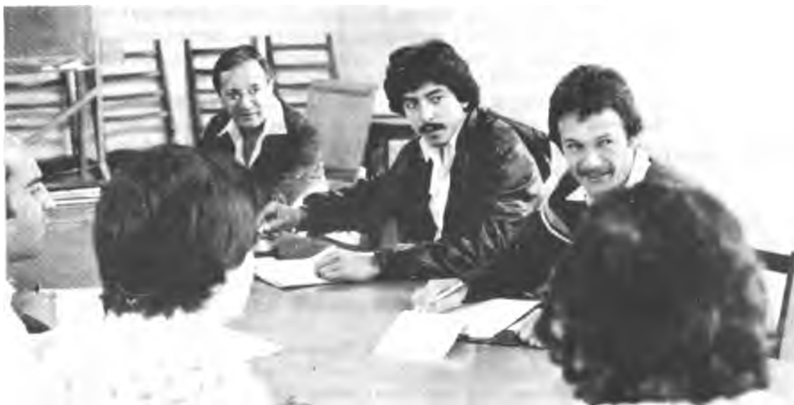
Cursos y Seminarios. Grupo de trabajo discutiendo los temas del curso para formular sus conclusiones.