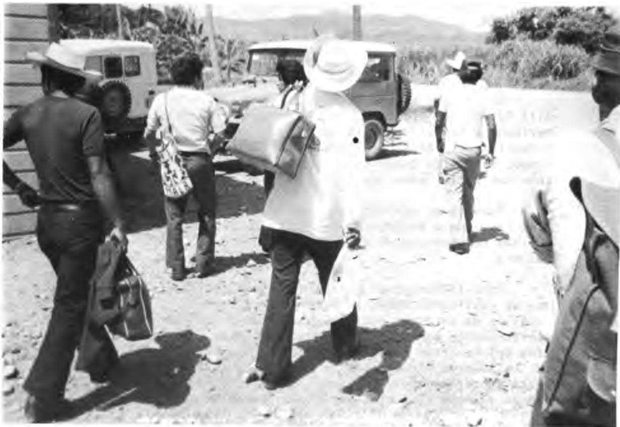
CAPACITACION RECIPROCA. Grupo de campesinos trasladándose a las Empresas Asociativas de base y de área donde desarrollarán su capacitación.

1. El Programa promocionó, organizó y financió la Capacitación Recíproca de 40 campesinos de Guatemala y República Dominicana para que vivieran durante un mes en empresas de base y de área de Honduras, a fin de obtener a través del ejemplo y de su propia participación, experiencia organizativa y una mayor copenetración de lo que es y significa el trabajo asociativo, así como, la existencia real y concreta de logros materiales, culturales y espirituales a través de la práctica del mismo mediante la gestión autónoma y plena participación de los campesinos en el proceso de desarrollo. El Programa también organizó y apoyó la capacitación recíproca interna, dentro del país, en Panamá y Honduras.