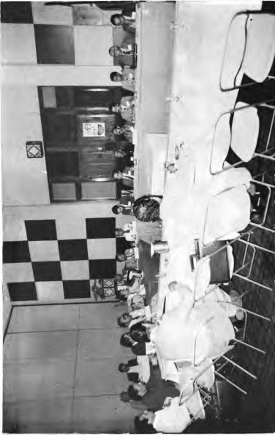
XIII Reunión de Ejecutivos de Reforma Agraria del Istmo Centroamericano y República Dominicana, Reunión Ordinaria de la Junta Directiva del PRACA. Vista de los participantes en una reunión de trabajo.