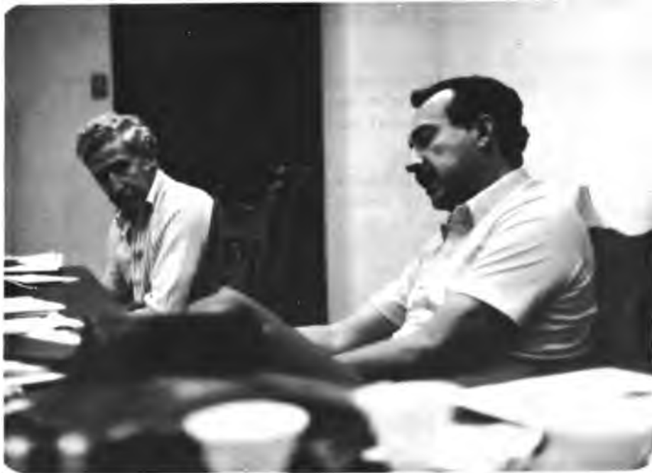
Especialistas del Proyecto GOBHOL-IICA/PRACA