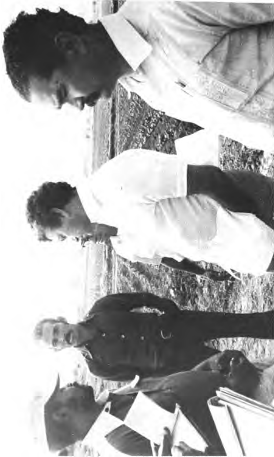
XIII Reunión de Ejecutivos de Reforma Agraria del Istmo Centroamericano y República Dominicana, Reunión Ordinaria de la Junta Directiva del PRACA. Los ejecutivos de Reforma Agraria en la visita realizada a los asentamientos, dialogan con los campesinos.