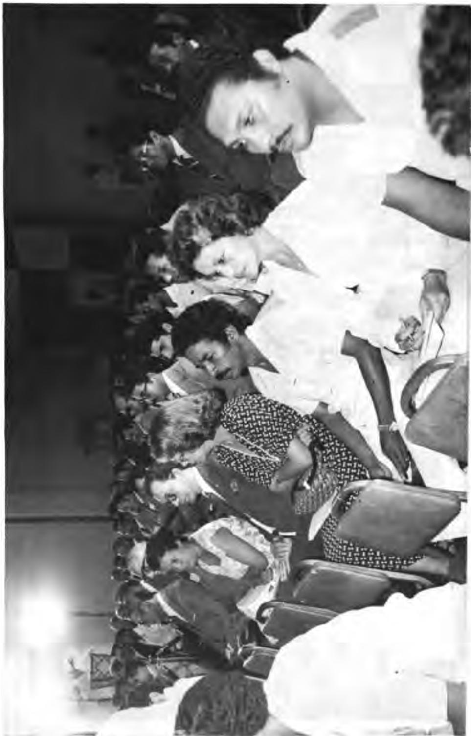
XIII Reunión de Ejecutivos de Reforma Agraria del Istmo Centroamericano y República Dominicana, Reunión Ordinaria de la Junta Directiva del PRACA. Vista general de los asistentes al acto inaugural de la Reunión.