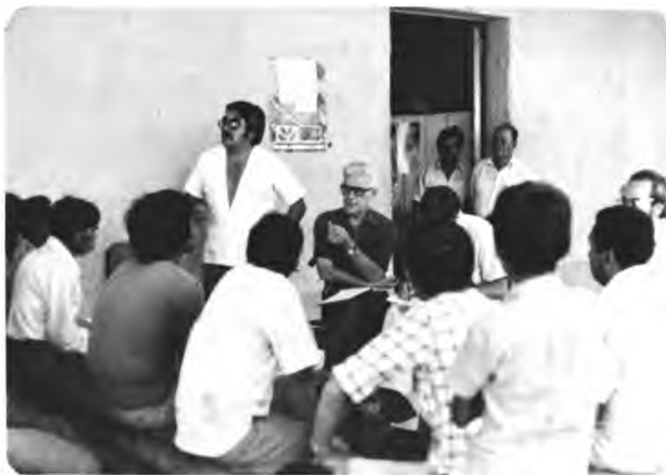
Evaluación del Proyecto GOBHOL-IICA/PRACA. Los miembros de la Misión de Evaluación reunidos con campesinos, conversan sobre la ejecución y resultados del Proyecto.

En el presente informe se omite dar mayores detalles sobre el resultado de la Evaluación, ya que se ha editado el informe completo, que será distribuido durante la próxima reunión ordinaria de la Junta Directiva del PRACA a los Directores de los Organismos de Reforma Agraria.