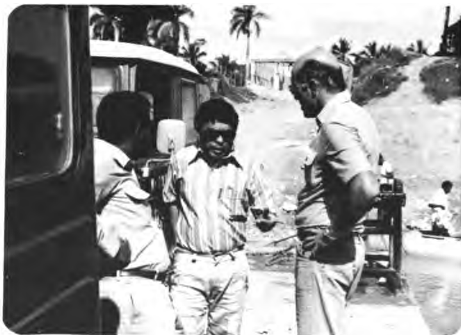
Especialistas del Proyecto GOBHOL-IICA/PRACA en un viaje de campo para prestar asesoría a los técnicos nacionales que apoyan a las empresas asociativas.