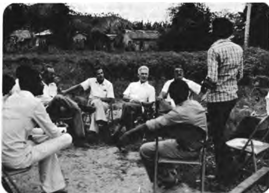
Evaluación del Proyecto GOBHOL-IICA/PRACA. La Misión Evaluadora cambiando impresiones con técnicos del Instituto Agrario Dominicano.