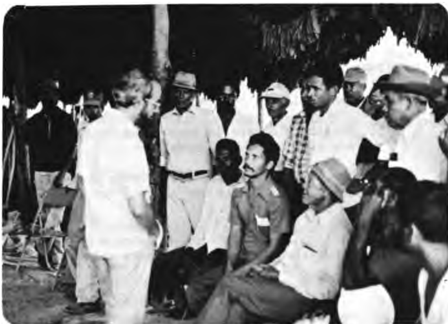
Evaluación del Proyecto GOBHOL-IICA/PRACA. Los miembros de la Misión Evaluadora reunidos con campesinos, conversan sobre la ejecución y resultados del Proyecto.