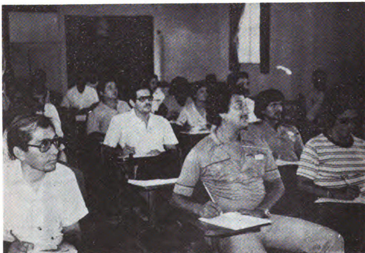
Participantes en el transcurso de una clase.

Con el objeto de perfeccionar la capacidad de operación en terreno de la Dirección Nacional de Desarrollo Social, se realizaron dos cursos intensivos en los que participaron 67 coordinadores sociales del 8 de junio al 29 de agosto de 1980, cada curso con una duración promedio de 5 semanas.