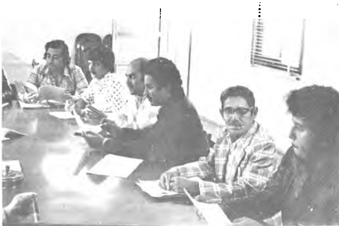
Cursos y Seminarios. Grupo de trabajo discutiendo los temas del curso para formular sus conclusiones.