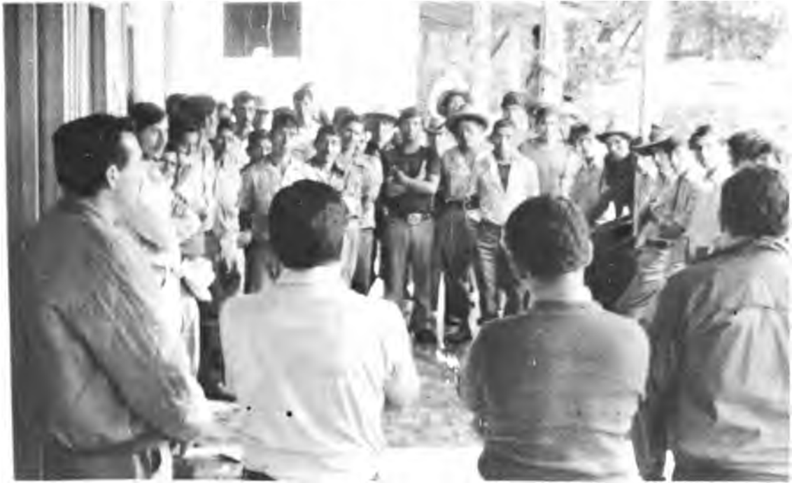
Laboratorios Experimentales. Inauguración de un Laboratorio Experimental.