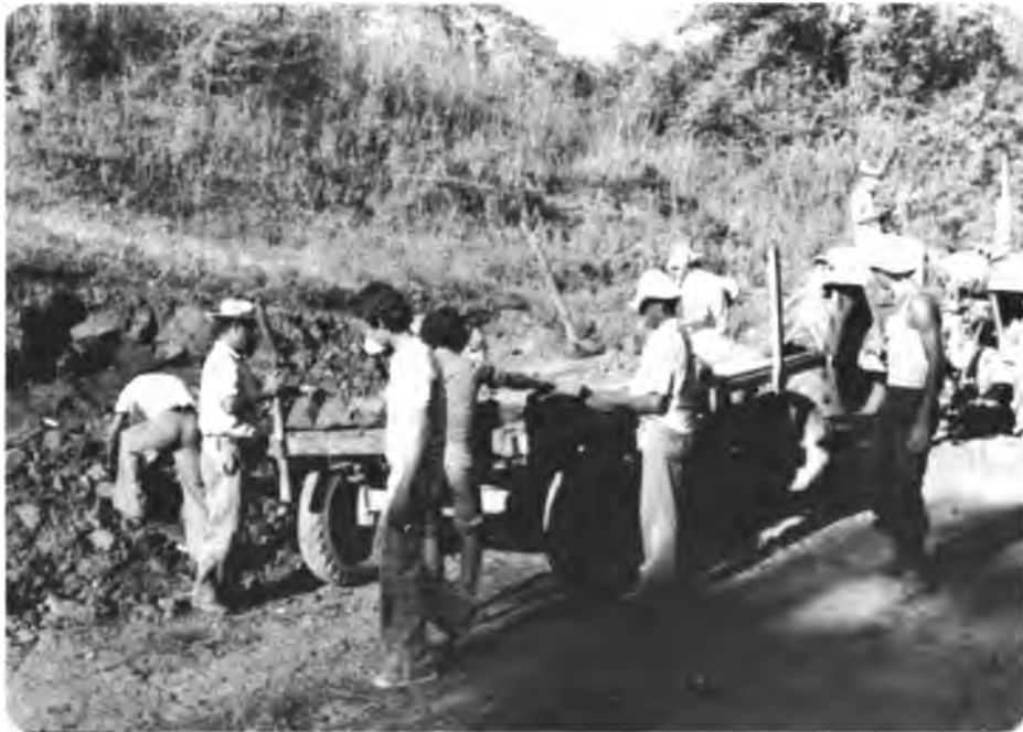
Laboratorios Experimentales. Grupo de campesinos realizando actividades agrícolas durante el laboratorio.