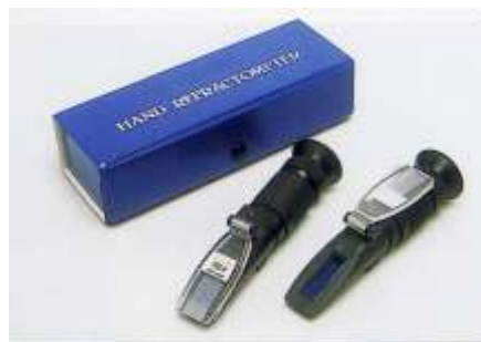
MATFER - ZUCHELLI