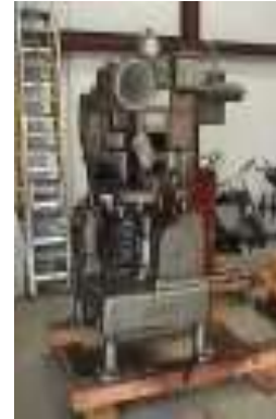
ACAMPO MACHINE WORKS