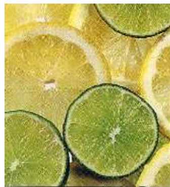
MATFER - ZUCHELLI