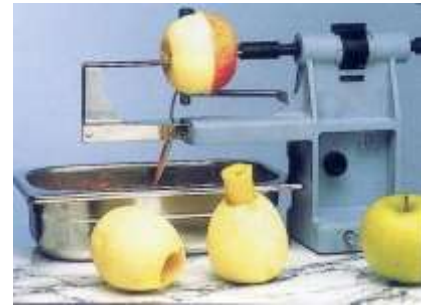
MATFER - ZUCHELLI